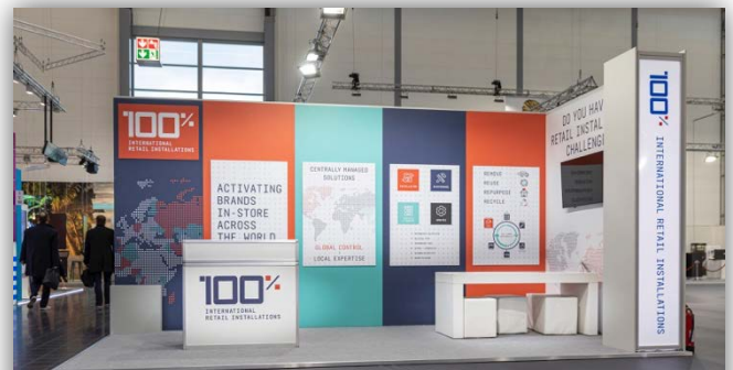
18 sqm with individual booth construction