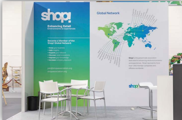
12 sqm complete package with standard booth construction and extra artwork