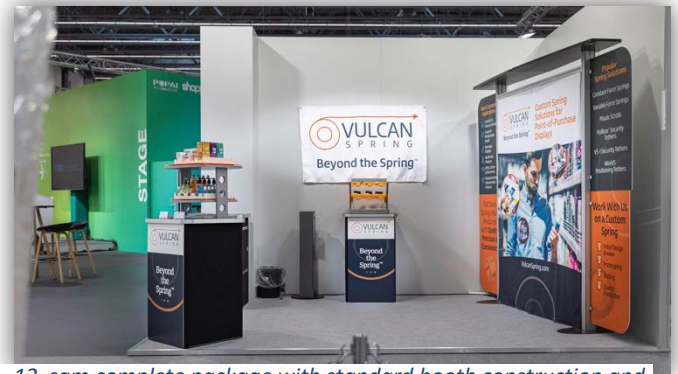
12 sqm complete package with standard booth construction and decoration by exhibitor